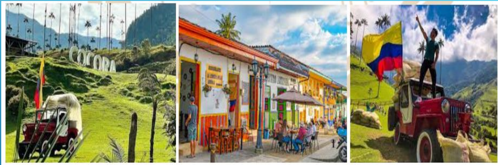
Salento Quindío y Valle del Cocora